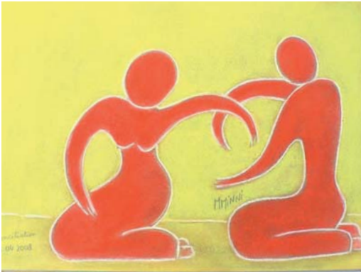
Réconciliation, pastel, 2008 - © Monique Minni